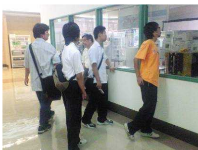
クリエイションコア東大阪見学 (ものづくりの館)

年間の行事で大きなものは、図書館見学、文化祭への展示部門への参加、昇陽中高等学校との合同読書会です。図書館見学は年1回、大阪府立中央図書館、大阪市立中央図書館、国立国会図書館の3館を順番に見学しています。昨年度は7月に大阪府立中央図書館とクリエイションコア東大阪を見学しました。文化祭では、点描画(貼り絵)を出品しました。A3サイズ