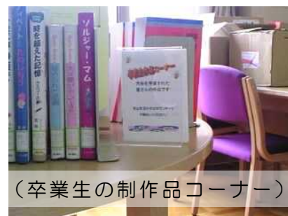
(卒業生の制作作品コーナー)

100均ショップのカードプレートなども利用しています。ワープロソフトや手書きで作成した案内をカードプレートに挟み、簡単な案内板を作成しています。