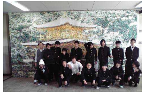
2010年文化祭参加作品「大阪の建物」？ （プリントアウトで画像ファイルを間違えた…。）

合同読書会では参加者を募集します。7月頃から打ち合わせを行い、テーマの選定（文庫本の短編で30～50pのもの）、司会や書記、交流会担当者を決め、準備します。読書会までにストーリーを把握し、質問にもなめらかに答えられるように練習会を3回ほど行いました。読書会当日は生徒だけで運営します。練習した甲斐もあって、交流会も楽しく過ごすことができました。