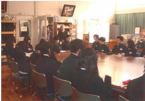
昇陽中等学校と今宮工科高校との合同読書会の様子